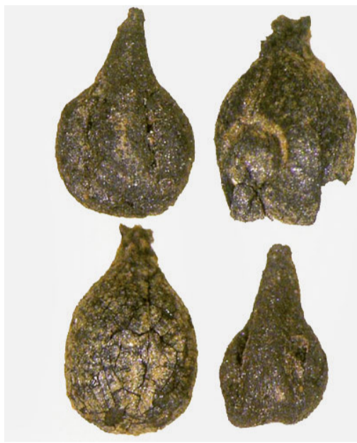
Traubenkerne. Aus eisenzeitlichen (oben) und aus römischen (unten) Schichten.

Römerzeit spricht für Weinpflanzen, die in unmittelbarer Nähe der Siedlung angebaut wurden. Diese Reste seien jedoch stark verkohlt, und so sei es schwierig, eine Verwandtschaft mit heute bekannten Rebsorten nachzuweisen.